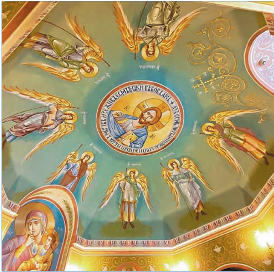
Роспись в храме Новомучеников г. Ухты.

Примером того, что старославянским наследием мы с успехом пользуемся по сей день, могут служить не только слова, но и модели построения словосочетаний и предложений. Одну из таких моделей мы