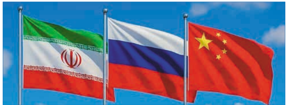
Флаги Ирана, России и Китая.

Практически одновременно с созданием СМП стали строить Трансполярную железнодорожную магистраль, которую прозвали сталинской стройкой века.