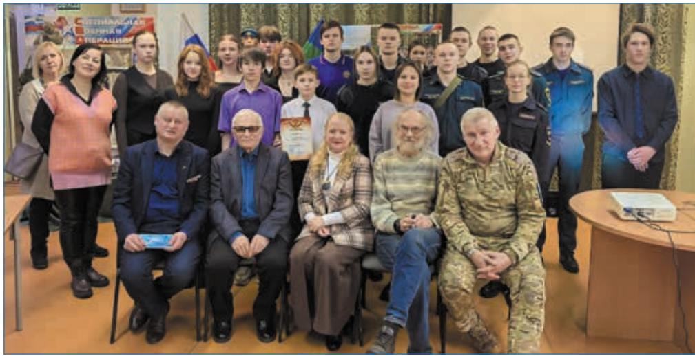
Участники и жюри конкурса