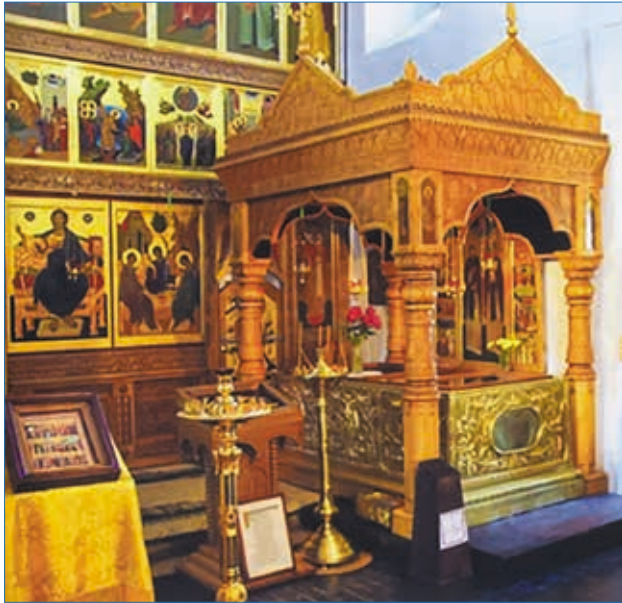
Рака (гробница) с мощами святых Петра и Февронии