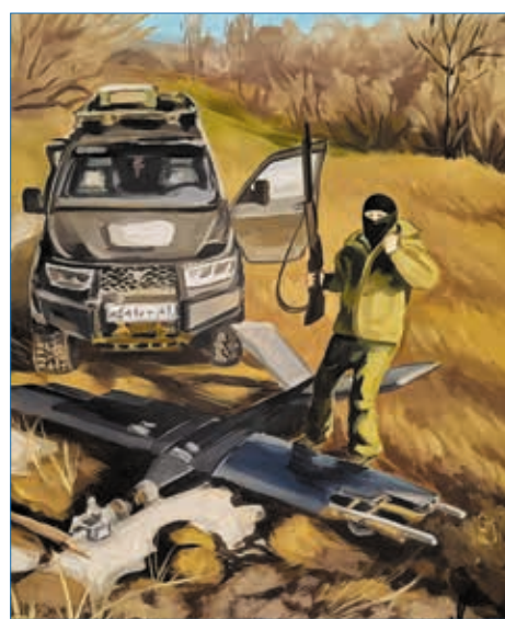
Рисунок Василисы Овсиенко