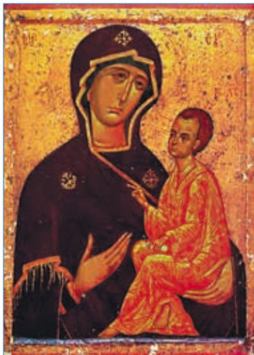
Тихвинская икона Божией Матери