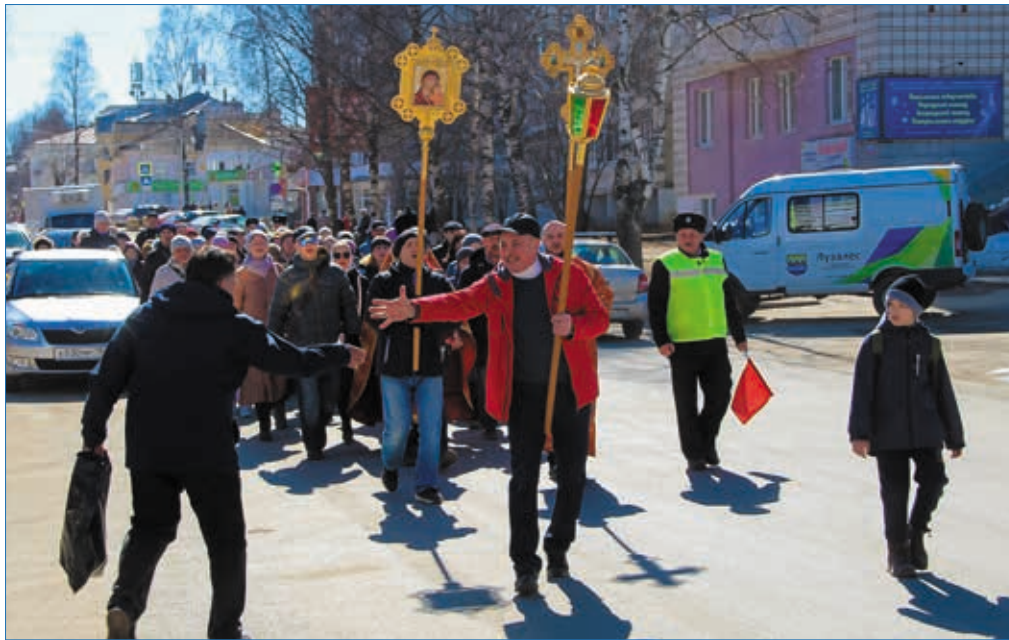
Пасха в Сыктывкаре.

Второй вопрос: как же её не потерять, чтобы вот эта пасхальная радость пребывала с человеком круглый год? Если мы грешим, своими неправильными поступками противоречим