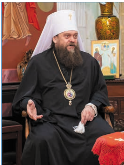
Митрополит Филипп

Святитель Николай Сербский, известный богослов минувшего века, размышляя о Пасхе, писал: «Христос воскрес — значит, жизнь сильнее смерти. Христос воскрес — значит, добро сильнее зла. Христос воскрес — значит, все упования христиан оправданы. Христос воскрес — значит, все жизненные трудности разрешены». И эта пасхальная радость, радость богообщения и утверждения обновленной жизни (Рим. 6:4) на началах добра и справедливости достигает сердец миллионов христиан, вдохновляет на дела любви и милосердия, помогает преодолевать невзгоды,