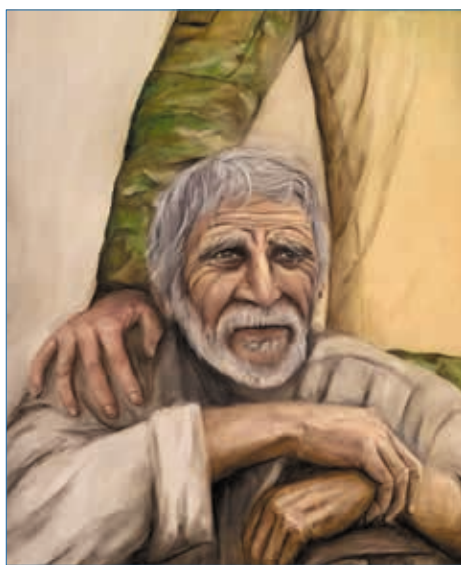
Рисунок Семёна Чередниченко

Я думаю, подвиг — это не только смелость в бою. Это ещё и готовность принять важное решение, осознать последствия. Каждый день мы делаем выбор: учиться или прогу-