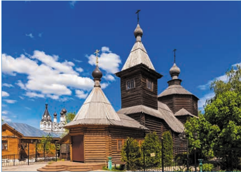
Храм в честь преподобного Сергия Радонежского