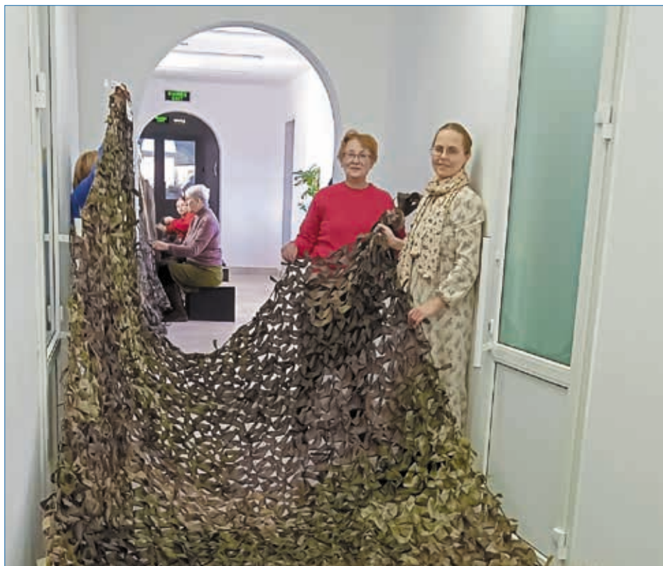
Волонтеры штаба «Родник»

О служении сестёр милосердия в Сыктывкаре, посещении мест заключения и помощи воинам, сражающимся на СВО, и их родным смотрите на телеканале «Юрган» или на странице Сыктывкарской епархии в соцсети «ВКонтакте».