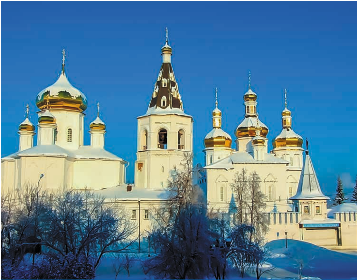
Свято-Троицкий мужской монастырь г. Тюмени.