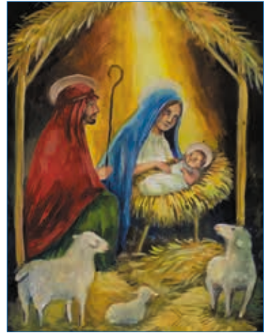
«Рождество Христово», рисунок Ирины Давыдовой (г. Воркута)

Кстати, с таким содержанием хорошо справились воркутинские участники выставки из СОШ № 35 с УИОП им В. Н. Бугаева.