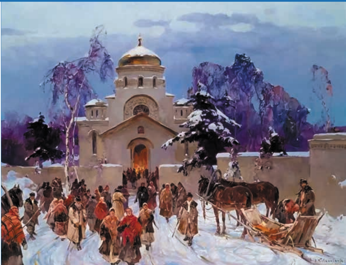
Картина «Рождество», Степан Колесников, 1909 г.

Не имеет никакого отношения к рождению также датское и норвежское «Jul». Это слово восходит к названию древнего языческого праздника «Йоль», который приходился как раз на середину зимы. Отсюда же исландское «Jól», финское «Joulu»