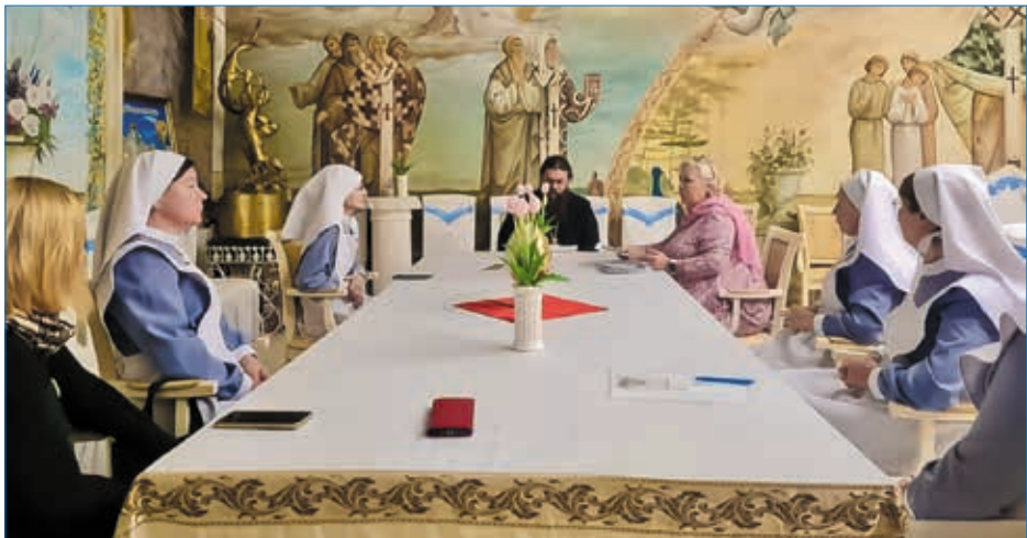
На первом заседании сестричества, которое возглавил владыка Филипп

Деятельность сестричества милосердия во имя святителя Стефана Пермского станет значимым вкладом в социальное служение Сыктывкарской митрополии и будет нести страждущим и обездоленным заботу, поддержку и христианскую любовь.