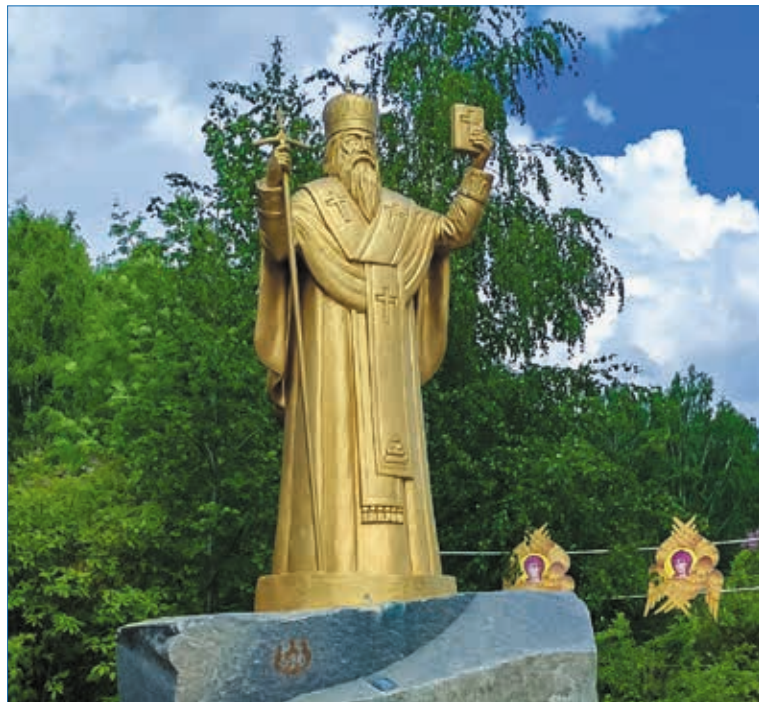
Памятник свт. Стефану Пермскому на территории Свято-Стефановского кафедрального собора г. Сыктывкара

Посох имеет 130 сантиметров в длину. Его основа – деревянный круглый в сечении стержень, толщиной около 19 миллиметров. Рукоять имеет длину 147 мм, толщину 17–20 мм. Вся конструкция состоит из нескольких участков (колен) длиной от 106 до 120 миллиметров, диаметром 23–24 миллиметра. Костяные колена разделены медными полосками. Кость, использованная для резьбы – лосиный рог. Часть рукояти посоха покрыта растительным орнаментом виноградной лозы. Такой орнамент был очень широко распространён в прикладном искусстве Древней Руси в течение многих веков.