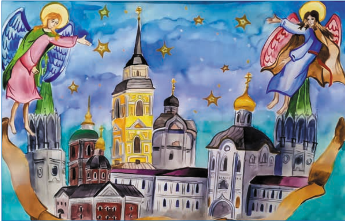
«Святой город Ростов», рисунок Марии Лютовой (г. Сыктывкар)

С точки зрения качества композиции и проживания идеи, поиска оригинального содержания можно выделить работы