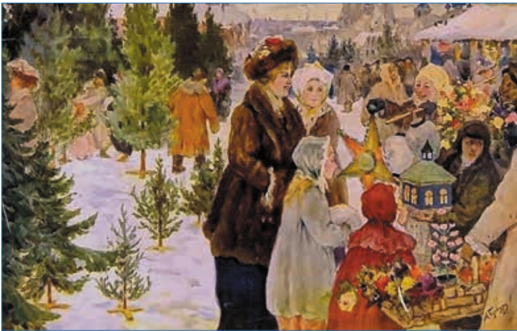
Картина «Рождественский базар», Александр Бучкури, 1906 г.

Одна из рождественских традиций — пение колядок. Колядующие приносят в дом особую