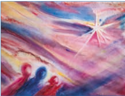
Вифлеемская звезда Картина Маргариты Ковальчук