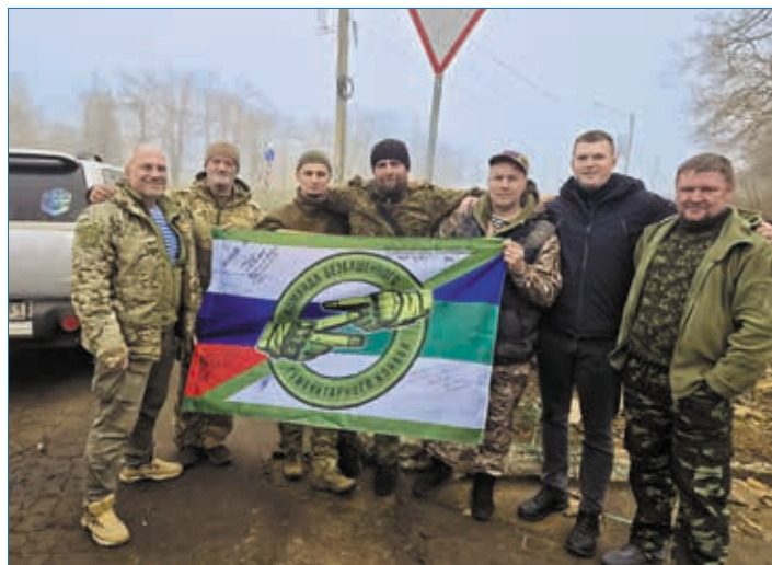
Участники гуманитарного конвоя

— Наш конвой свою задачу выполнил. Мы проехали более 8 тысяч километров от Ухты до Донецка, Херсонской области и обратно. Силою помощи и тепло из дома передали жители республики от Усинска до Летки. Добровольцы Усть-Вымского района сплели 300 маскировочных сетей. Нам удалось попасть в 84 подразде-