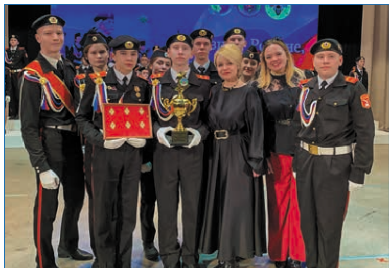
С кадетами школы № 18 — победителями фестиваля, 2023 г.