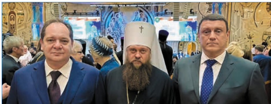
Глава Коми Ростислав Гольдштейн, митрополит Филипп, председатель правительства РК Дмитрий Братыненко