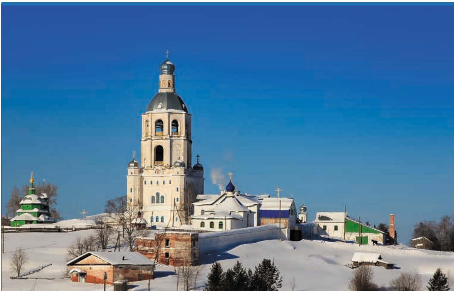
Троице-Стефано-Ульяновский мужской монастырь, Усть-Куломский район Республики Коми