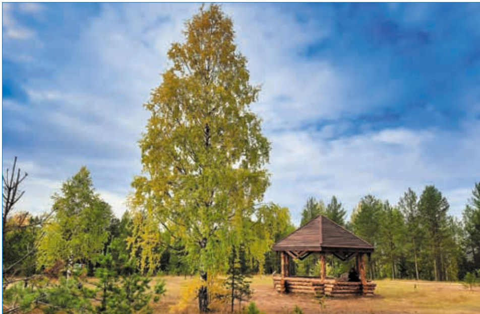
На Параськиных озёрах