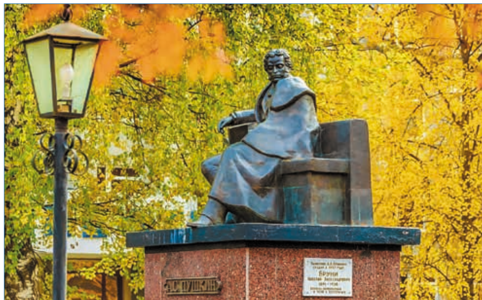
Памятник А. С. Пушкину в Ухте

– Что вы, милый человек, что вы, батюшка, вам никак всю жизнь не выдержат. Знамение вам будет вполне мирское. Прямо из-под вас место службы уберут. Я свое служение тоже оставлю в те же сроки. Так что потерпите и смиритесь... (прп. Нектарий Оптинский).