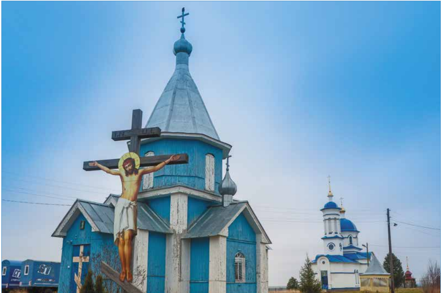
Ыбский Серафимовский женский монастырь

И мы стали устраиваться и обживать ставшее на сутки родным