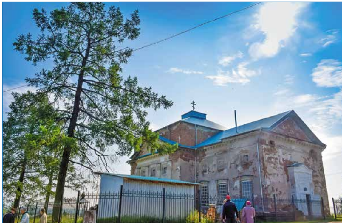
Церковь Благовещения Пресвятой Богородицы в селе Сизябск

Затем по комсомольской путевке его отправили служить в органы внутренних дел. Сначала отправили на учебу в Чебоксарскую школу милиции, окончив ее, он в 1981 году поступил на работу в органы внутренних дел Ухты. Начиная службу командиром взвода вневведомственной охраны. Дослужился до коман-