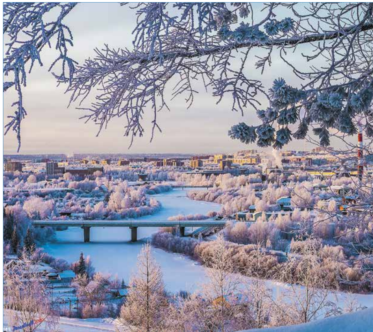
Зимняя Ухта.

Архиепископ Питирим (Волочков), член Союза писателей России