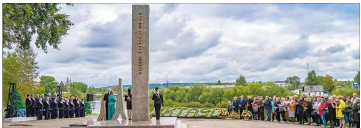
Памятный знак «Первопроходцам Севера»