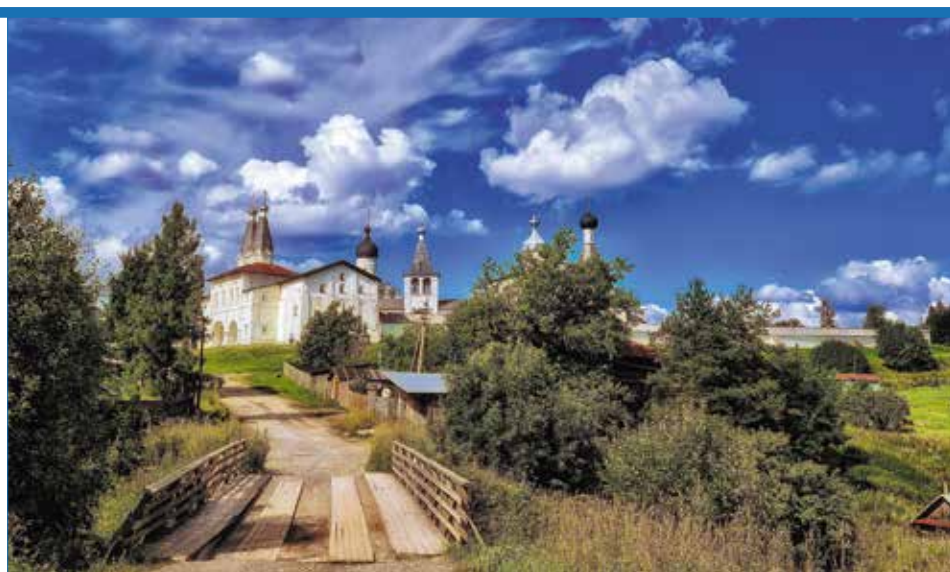
Ферапонтов Белозерский Богородице-Рождественский монастырь

С Положением можно ознакомиться на сайте газеты «Колокол Севера» – колоколсевера.рф в рубрике «Конкурс». Уточнить информацию можно по телефону: 8912-948-41-73.