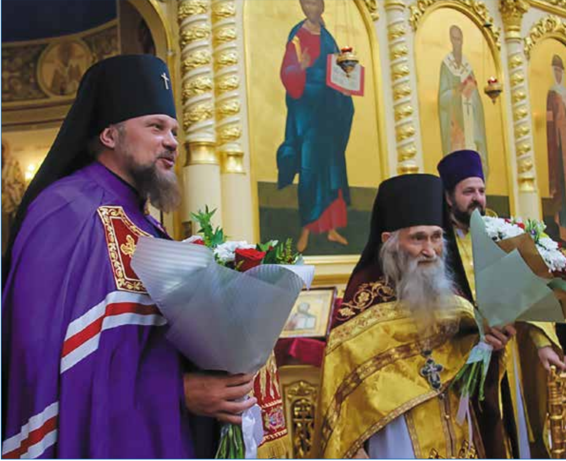
Архиепископ Питирим и старец Илий

В июле в Республике Коми побывал всероссийский старец, духовник Патриарха Московского и всея Руси Кирилла, схиархимандрит Илий.