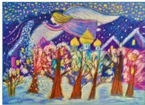
Рисунок Elizavety Shirinkina из Детской школы искусств Емвы