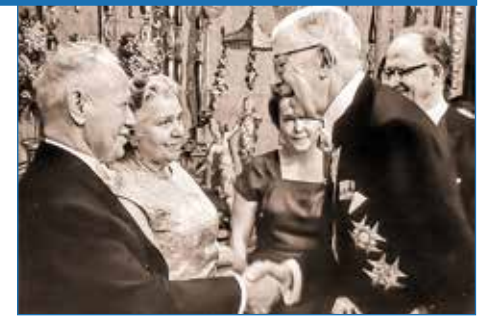
Шолохов с супругой на церемонии вручения Нобелевской премии

лило салон самолёта. Писатель прильнул к иллюминатору, его лицо разгладилось и посветлело, видимо, вспомнилось нечто приятное.