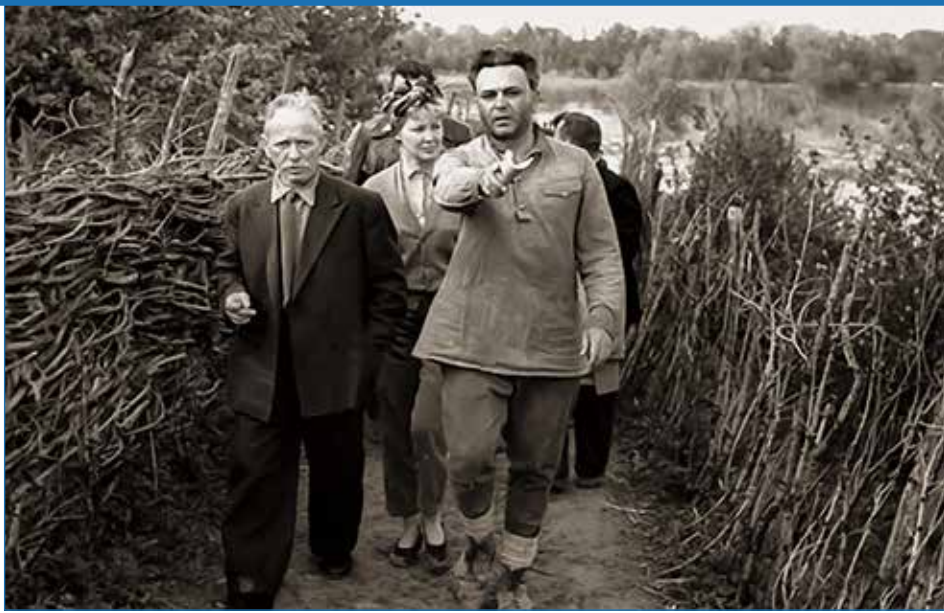
Шолохов и Бондарчук на съёмках фильма «Судьба человека»

– Батя, ты ли это? – Я, сынок. Худо тебе?