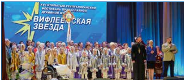
В этом году участниками фестиваля стали более 400 исполнителей и коллективов