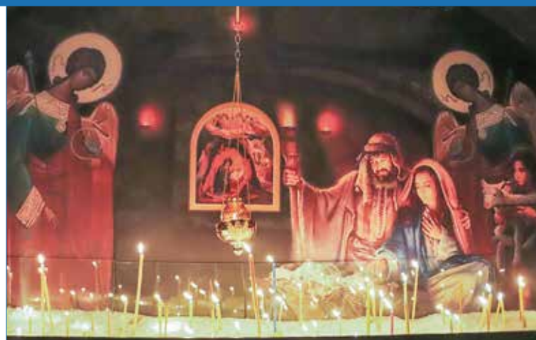
Рождественский вертеп у храма Новомучеников в Ухте, 2020 год, автор Алексей Крепышев

Итоги конкурса будут подведены на Пасхальной седмице 2020 года и обязательно будут опубликованы в газете «Колокол Севера», как и лучшие работы участников.