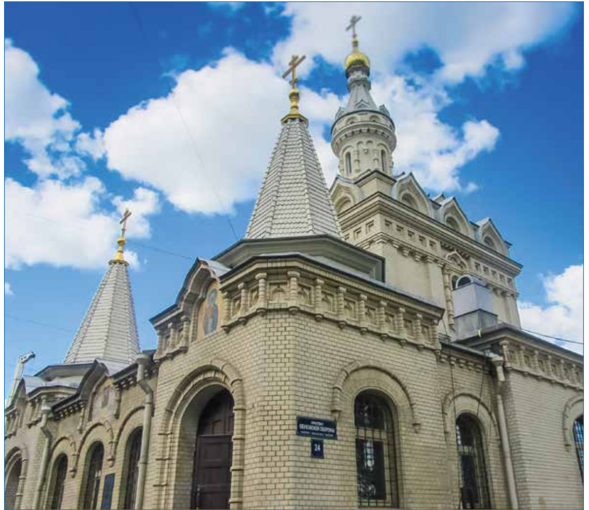
Скорбященская церковь находится в 20 минутах ходьбы от станции метро Площадь Александра Невского

Ее могилка затерялась после разрушения Скорбященской церкви, но в 1997 году была обретаена вновь, уже после передачи часовни под крыло Зеленецкого монастыря.