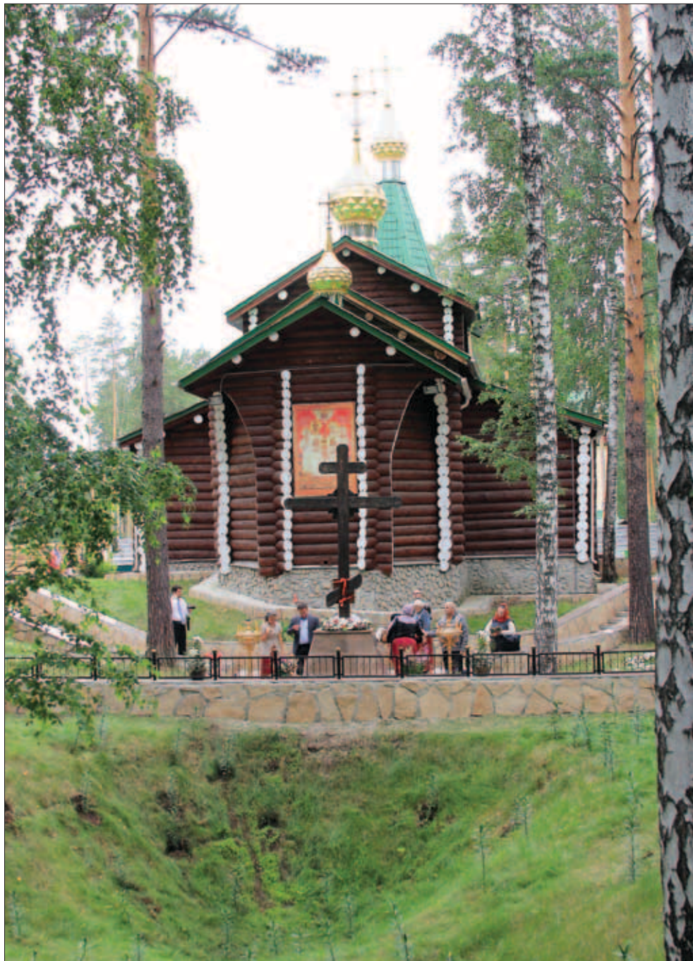
Ганина Яма, монастырь Царственных Страстотерпцев — на месте уничтожения останков Царской семьи.

Посредством Интернета я выяснил, как можно проехать до Ганиной Ямы. Для этого надо было