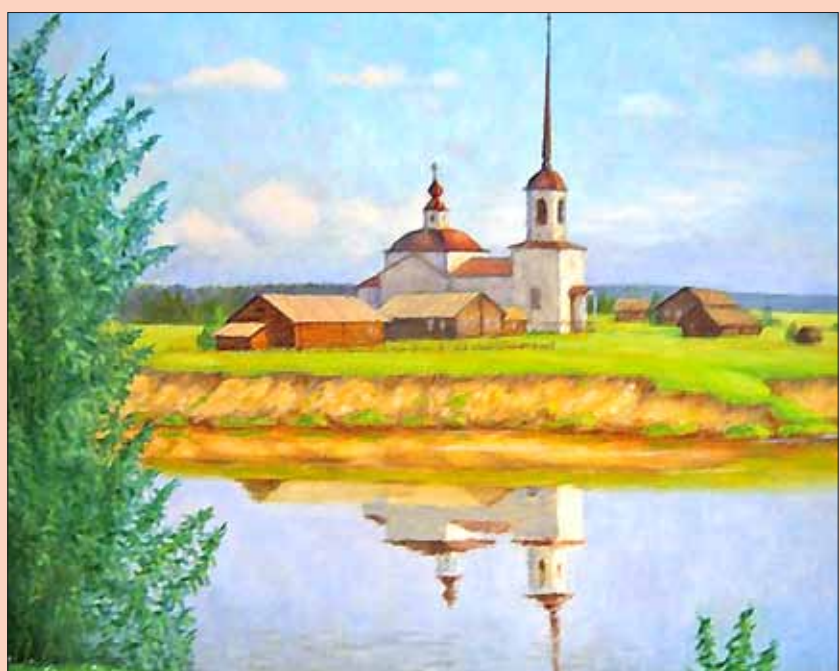
«Георгиевская церковь на Вычегде» Сергей Худяков.