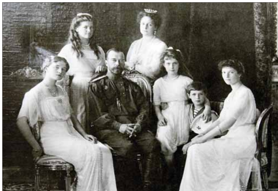
Фото Царской семьи (музей монастыря на Ганиной Яме).

В неблизкий путь, несколько десятков тысяч паломников (официальные данные сильно разнятся - от 35 до 60 тысяч человек) выступили в 3 часа ночи. Я двинулся в путь практически сразу за духовенством, плотность в крестном ходе была настолько большой, что приходилось передвигаться маленькими быстрыми шажками. Нормальным шагом идти в такой толчеи было невозможно, поскольку обязательно кто-то наступал тебе на пятку, или ты носком обуви мог снять кроссовок с идущего впереди паломника. Решил переместиться к обочине проспекта, а затем и вовсе вышел на пешеходный тротуар, здесь было немного по-свободнее. Темп ходьбы был очень высок, пока двигались по освещенным улицам города, идти было нетрудно. Через некоторое время вышли на окраину Екатеринбурга, здесь приходилось смотреть под ноги, поскольку освещенность в пути была недостаточной. Шли без привалов, изредка останавливались, когда возникал по той или иной причине затор, обычно связанный с резким сужением дороги. На подъемах я мог оглянуться назад и посмотреть вперед, огромное море паломников, казалось, не имело ни конца, ни начала, плотная масса людей вытянулась в обе стороны до самого горизонта, особенно величественно все это выглядело на проспектах города, когда крестноходцы шли плотными шеренгами по 40 - 50 человек, полностью перегораживая широкую магистраль. Пройдя примерно половину пути, я стал