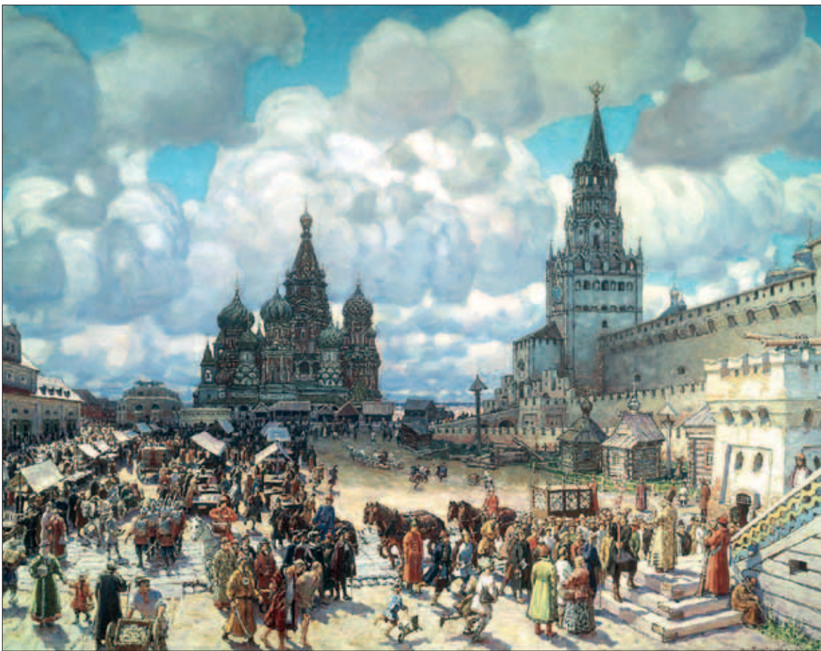
«Красная площадь во второй половине XVII века», А.М. Васнецов

«...Царские ратники обходили питейные дома, где продавали вино, водку и прочие опьяняющие напитки, и все их запечатывали, и они оставались запечатанными в течение всего поста. Горе тому, кого встречали пьяным или с сосудом хмельного