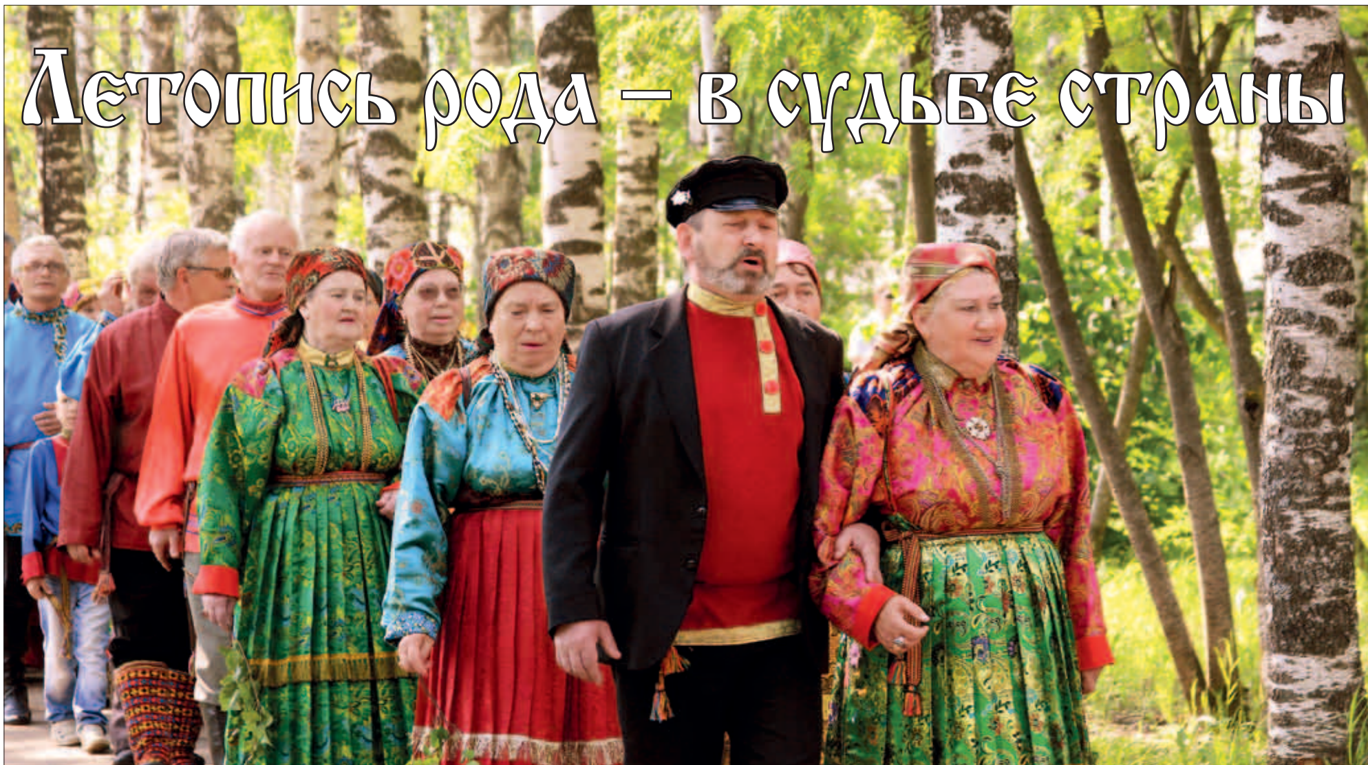
Усть-Цилемская горка в Ухте.