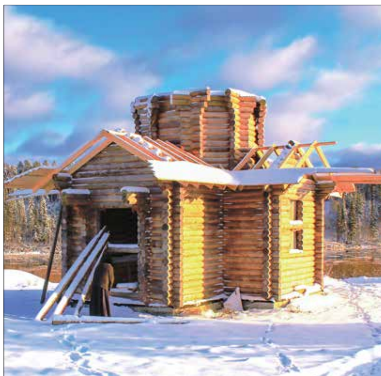
Будущий храм св. Трифона.

Я торопливо щелкал и щелкал затвором своего фотоаппарата, стремясь запечатлеть как можно больше фрагментов ожившего окружающего нас мира.