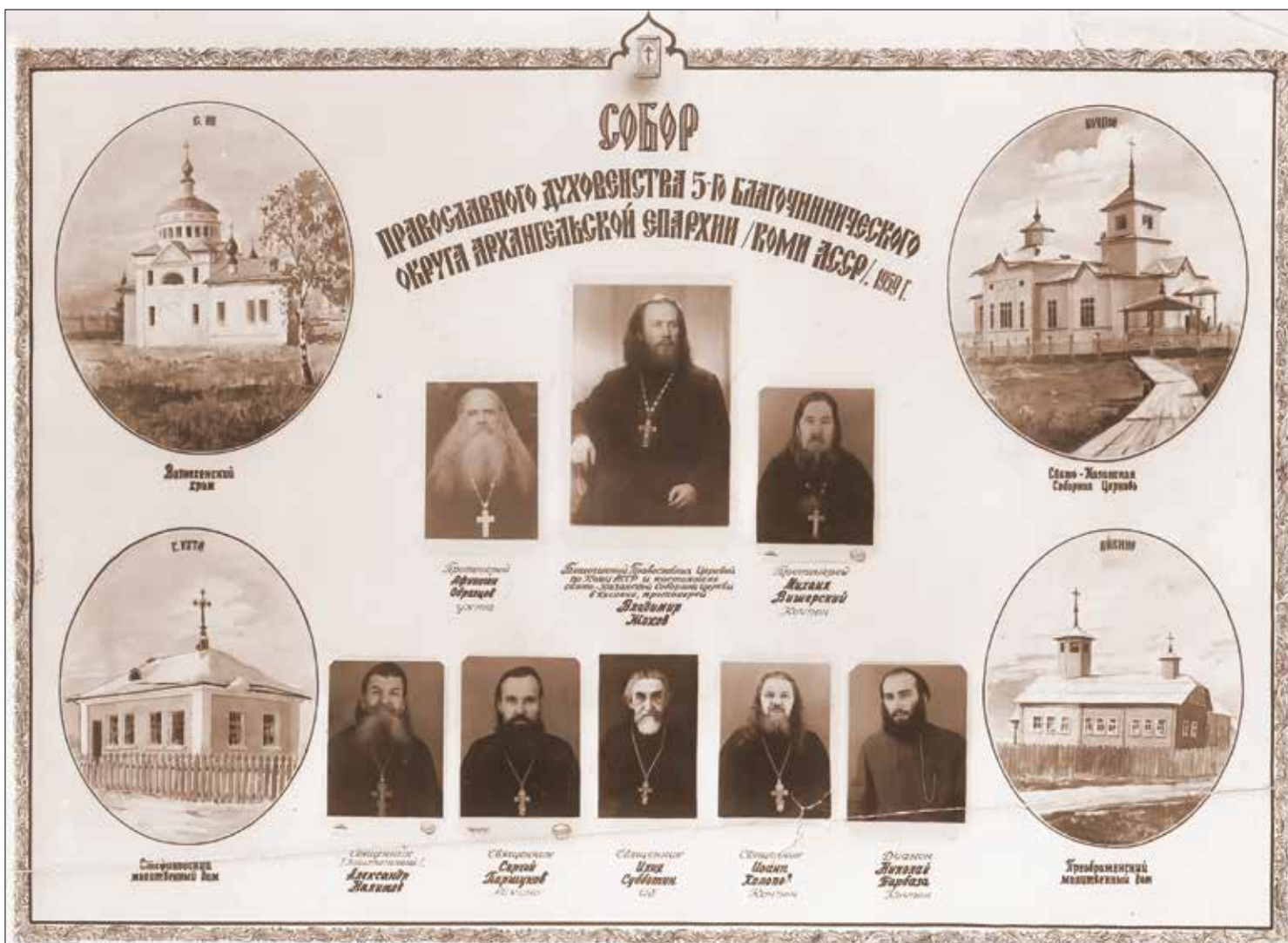
На фотографии «Собор православного духовенства 5-го благочинного округа Архангельской епархии (Коми АССР) 1959 год» изображены: