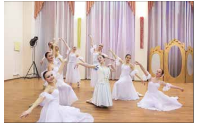
Фрагменты представления «Белоснежка и семь гномов».