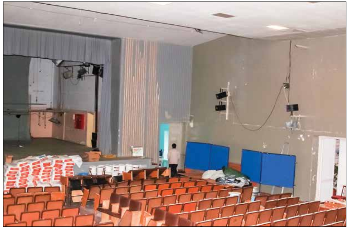
Актовый зал – в разрухе.

На сегодняшний день в плачевном состоянии находятся актовый и спор-