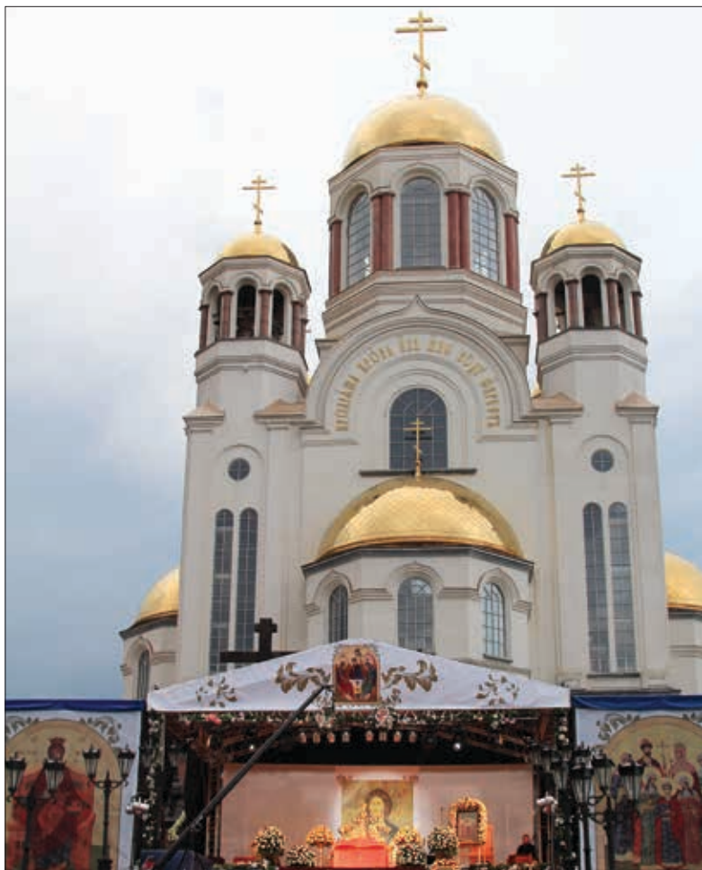
Храм-на-Крови, г. Екатеринбург.

километров скорбного пути до места, где были сожжены и спрятаны останки Царской семьи и их верных слуг.