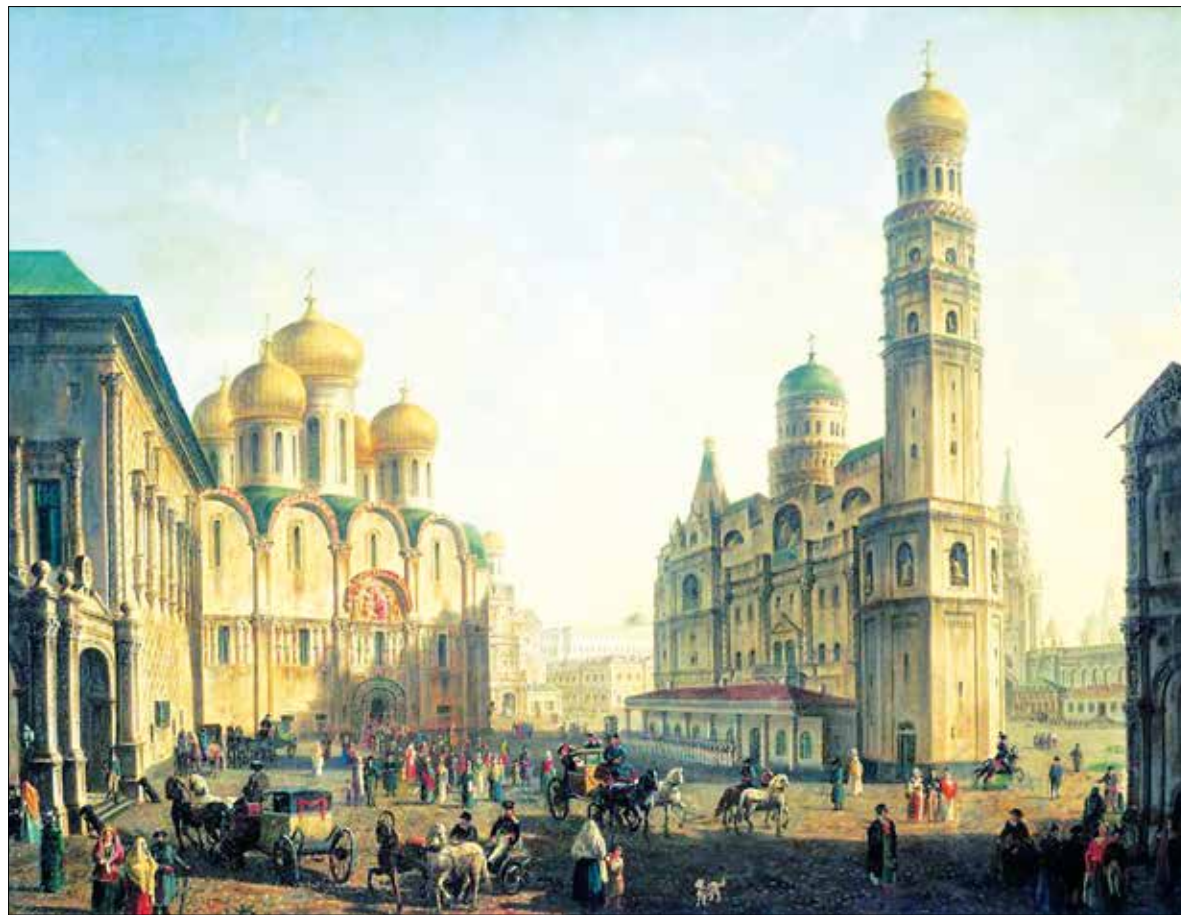
Соборная площадь в Московском Кремле. Федор Алексеев.

В одной из передач известный продюсер Бари Алибасов озвучил интересный факт, оказывается, ежегодно в нашей стране выпускается около полутора тысяч вокалистов. А