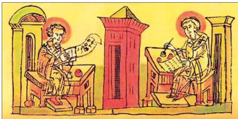
Иллюстрация из книги «Слово о законе и благодати».

Одним из самых ранних выдающихся произведений русской литературы является «Слово о законе и благодати» (написано между 1037-1043 гг. митрополитом Иларионом). Создано оно за несколько десятилетий до написания Нестором «Повести временных лет». Владыка Иларион указывает, что Евангелием и крещением Бог «все народы спас», прославляет русский народ среди