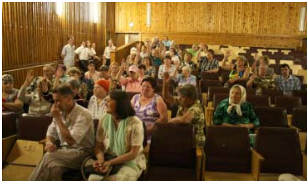
Жители поселка голосуют «за»

гие годы беспорядного пьянства разучилось. Невозможно заставить человека жить по-другому, если до этого он десять, а то и пятнадцать лет беспорядно пил, деградируя все больше и больше, опускаясь на самое дно пропасти, туда, где совсем близко врата ада. И только обращение ко Господу, горячая и искренняя молитва родных и близких смогут спасти этих людей от неминуемой духовной и физической гибели. Отцы и матери, бабушки и дедушки, начиная осознавать это, приходят к единственно правильному выводу: для того, чтобы спасти своих детей и себя, надо обратиться к Богу, начать молиться истово и искренне. И для этого-то нужна самая малость – построить часовенку или церковь, где люди мог-