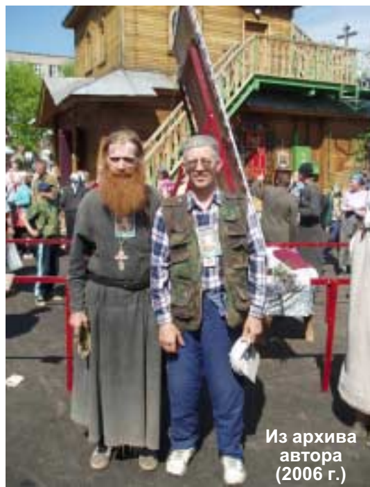
Из архива автора (2006 г.)

Представляете, сколько ассоциаций, чувств и эмоций возникает при прочтении