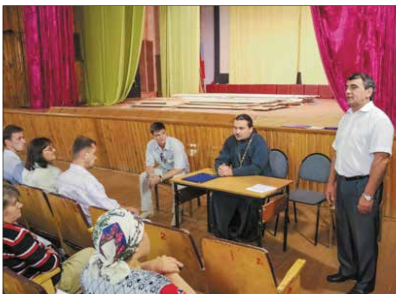
2 августа 2009 года – собрание инициативной группы боровчан