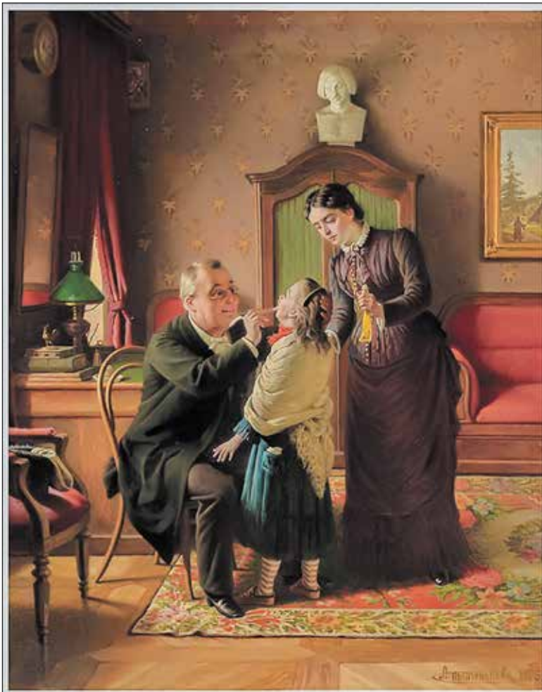
Картина «Детский доктор» Алексея Протопопова

«Затем больной усаживается спиной к врачу, положив руки на колени, опустив плечи. Выстукива-