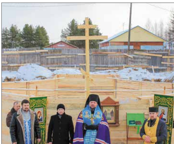
25 октября 2014 года – освящение закладного камня