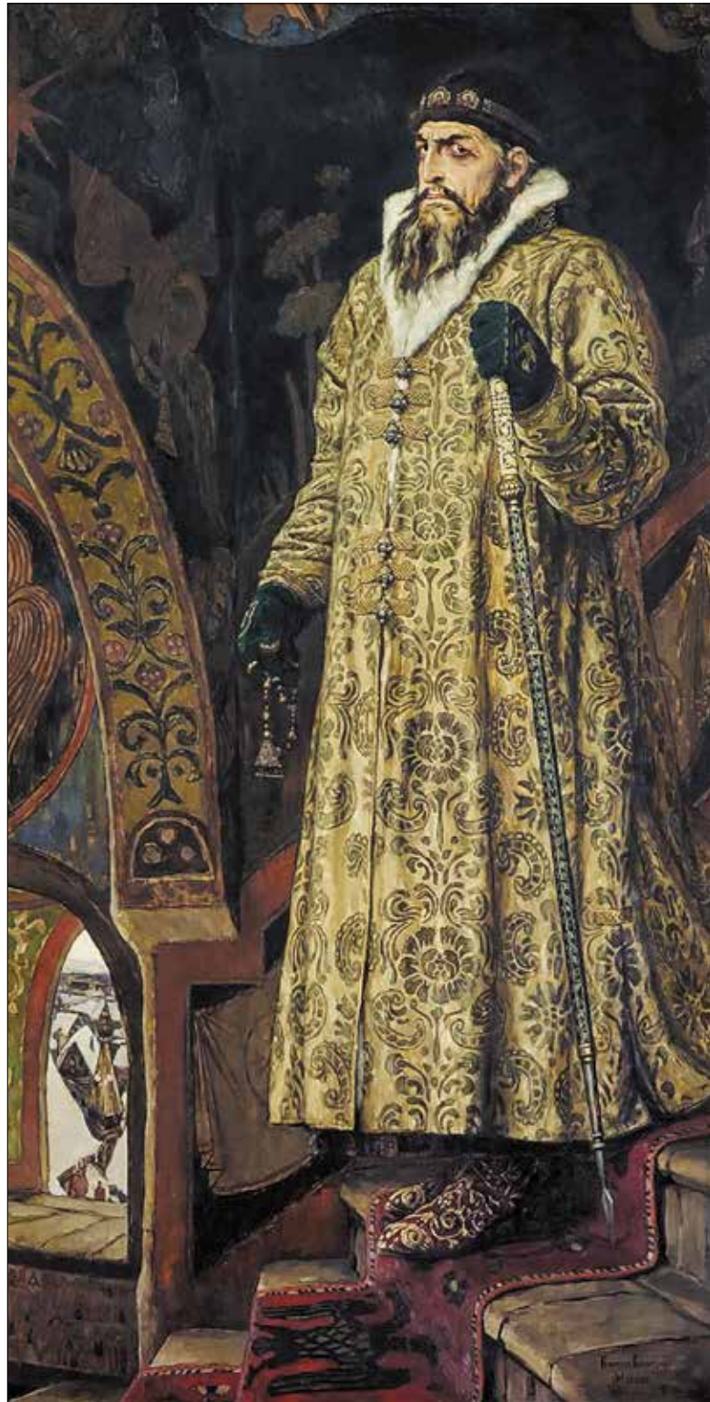
Картина «Царь Иван Васильевич Грозный» В. М. Васнецова