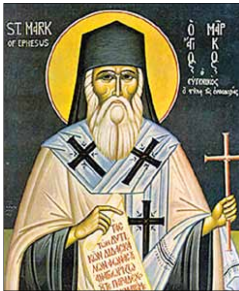
Святитель Марк Ефесский.

наказывать его за грехи. В своем, составленном около 1037 года, «Слове о законе и благодати» митрополит Иларион, первый русский, ставший главой молодой русской православной церкви, утверждает равноправие Руси с Византией, претендовавшей на мировое господство и мировое руководство. Он говорит: «Сбыться о нас языцех речено: открывает Господь мышцу свою святыю пред всеми языки и узрят все концы земле спасение, еже от Бога нашего». Летописец, составлявший в том же веке первую историю русского народа, развил эту же мысль об избрании Руси Богом для особой христианской миссии в мире. В своем трактате он рассказывает о посещении Руси апостолом Андреем и пишет, что, остановившись на горах берегов Днепра, апостол предсказал большое будущее христианству в этой стороне: «На сих горах воссияет благодать Божия, имать град великий и церкви многи Бог воздвигнути имать».