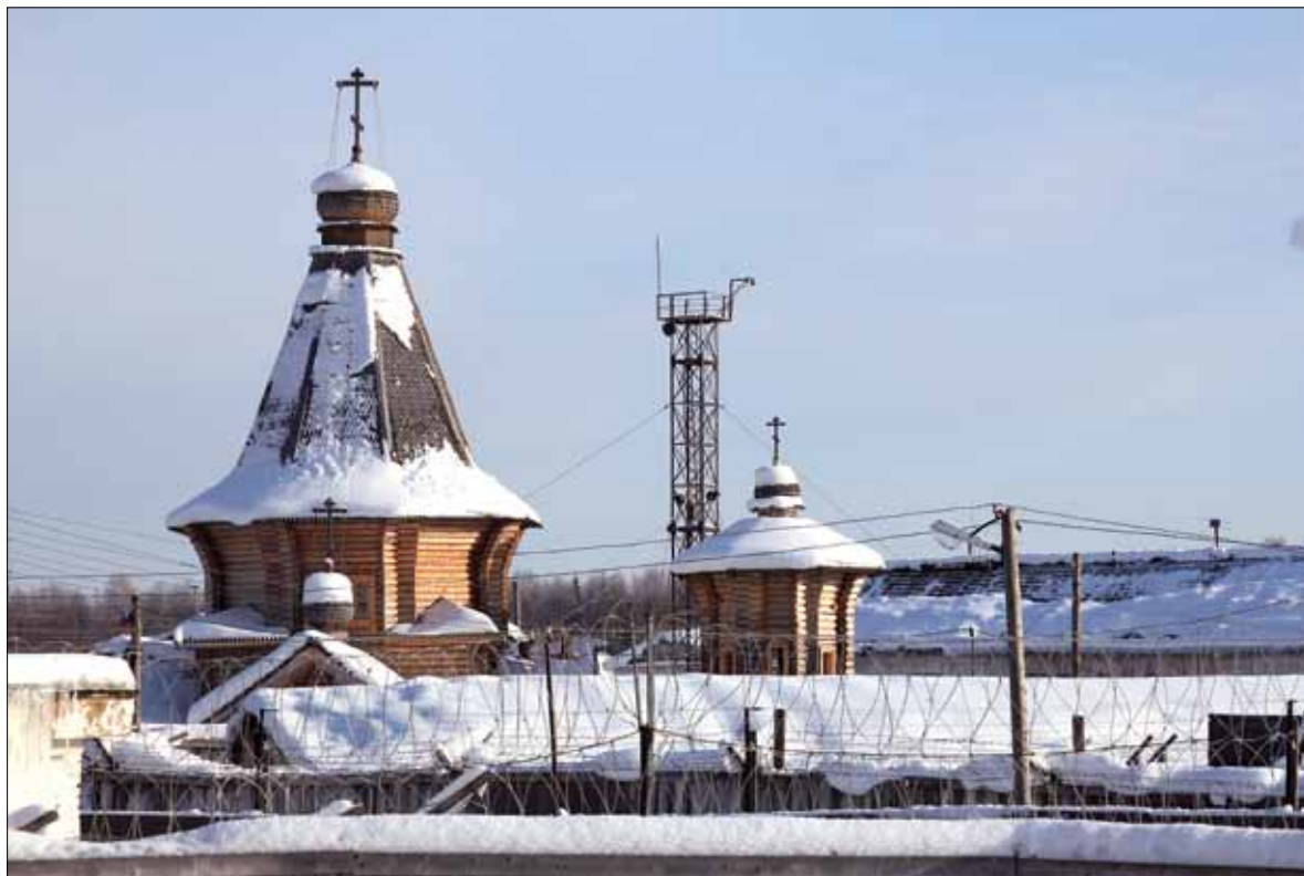
Свято-Никольская церковь в Вожской колонии.

Тогда было радостно – сейчас грустно. Храм. Сколько братии и осужденных приняли участие в его возведении. Сколько со свободы людей вложились