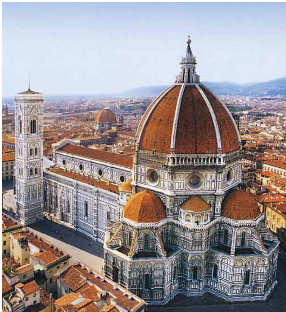
Собор Санта Мариа дель Фьоре, где была подписана Уния.

Принятие православными латинского догматического учения было началом бесславного поражения