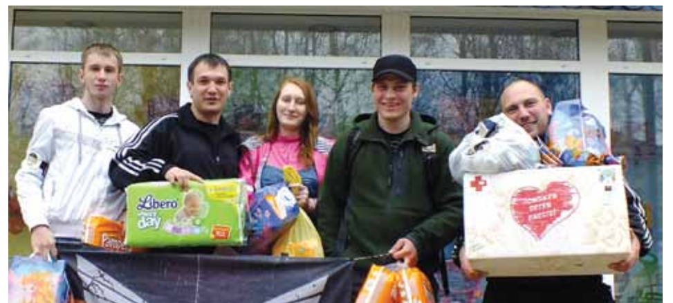
Участники акции, посвященной Дню защиты детей. Молодежный клуб Свято-Стефановского храма, волонтерское объединение «Пульс» провели сбор подгузников, игрушек и детской одежды для малообеспеченных ухтинцев. Подгузники передали в Дом ребенка, остальное – в центр «Милосердие» Свято-Никольского храма.