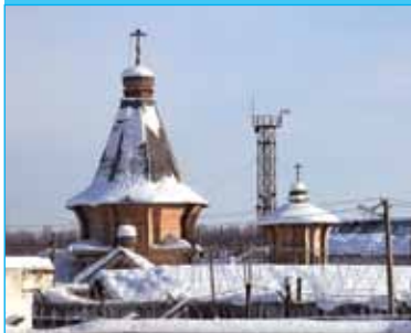
На новом месте такого не повторить!