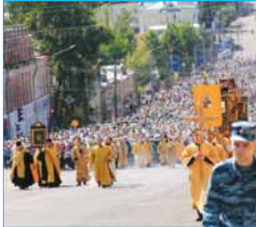
Великоречский крестный ход 10 лет спустя