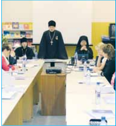
Церкви и учителям следует объединить усилия

В преподавании основ найти золотую середину