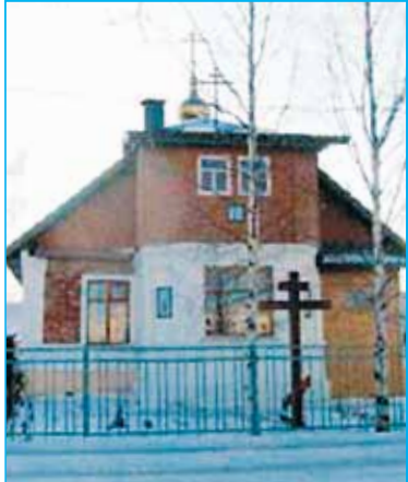
Социальные проекты Ухтинского Заречного округа